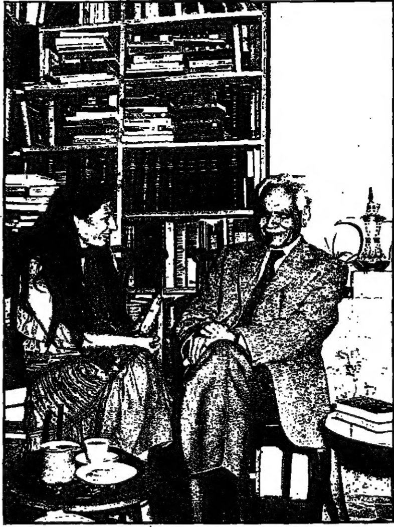
مع خبسة الآف مجلد ... وقسمت طوران

طام فكرة عن برنامجي ؟ جارة عن رسائل ترد من أسئلة قصيرة ، كان مائل جدا البيت من هذا الصداقة ... وبالطبع لغة وأطلاعا واسعا في بحثنا في كتب الأديب ، في قيل فيها ذاك البيت